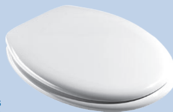
Charnière et vis monobloc en crochet